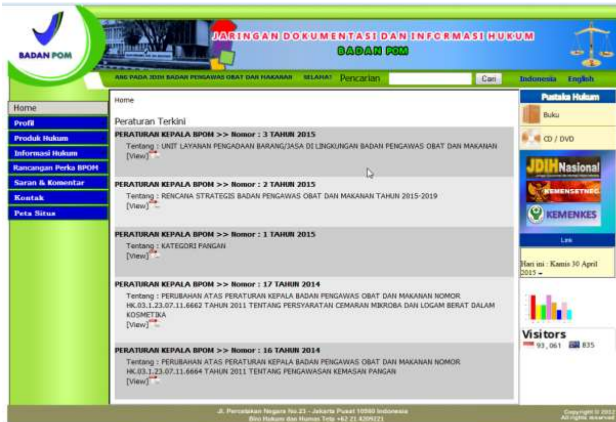
Gambar 1. Tampilan Subsite Jaringan dan Dokumentasi Informasi Hukum

Road Map Reformasi Birokrasi Badan Pengawas Obat dan Makanan Tahun 2011 – 2014, meliputi 2 (dua) area perubahan dengan capaian – capaian di area perubahan tersebut adalah sebagai berikut: